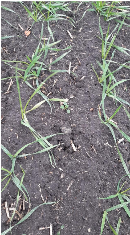
Boxer 2 l/ha